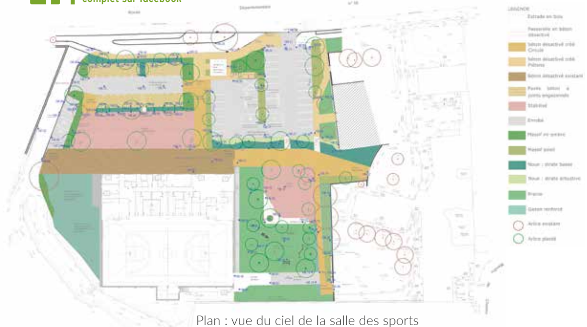
Plan : vue du ciel de la salle des sports et de tous ses aménagements extérieurs

Retrouvez l'article complet sur facebook