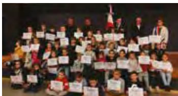
Élèves de l'école publique Maurice Gilardon

symbolique de leur engagement citoyen précoce !