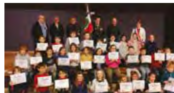
Élèves de Notre Dame de Lourdes